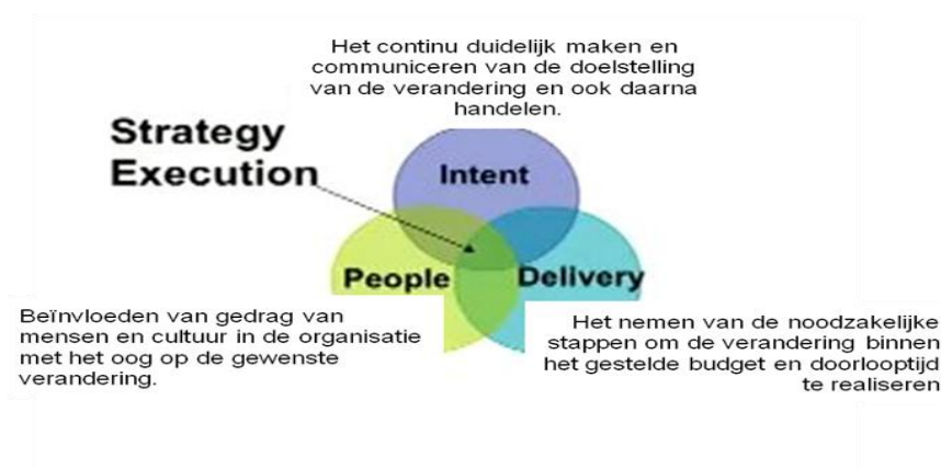
Figuur: kernelementen in een ontwikkelproces

In paragraaf 1.4 heeft de Commissie een denkmodel gepresenteerd, waarmee een ontwikkelproces kan worden beschouwd.