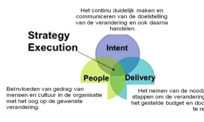
Figuur: kernelementen in een ontwikkelproces

In verband met de hierboven genoemde centrale vraagstelling, hanteert de Commissie een denkmodel 2 , waarmee een ontwikkelproces kan worden beschouwd. De essentie van dit denkmodel is gelegen in de gedachte van het ontwikkelproces naar Zelfsturing als de uitvoering van een strategie. Bij strategie-uitvoering zijn volgens dit denkmodel een aantal elementen van doorslaggevende betekenis.